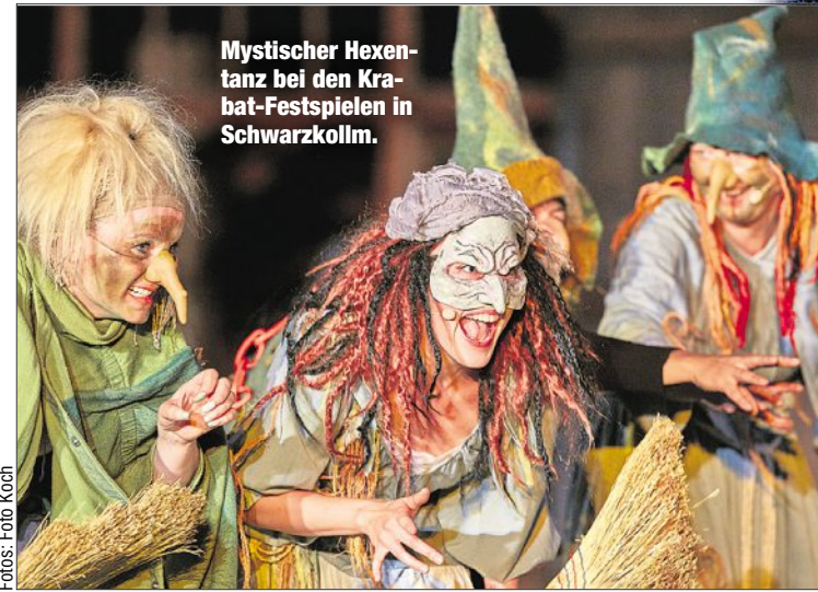
Mysterischer Hexentanz bei den Krabat-Festspielen in Schwarzkollm.

Der Kartenverkauf für die Krabat-Festspiele 2017 beginnt am 8. August. Schnell zugreifen: Die Karten für 2016 waren binnen zwei Tagen weg! KK