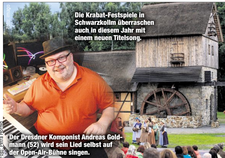
Die Krabat-Festspiele in Schwarzkollm überraschen auch in diesem Jahr mit einem neuen Titelsong.