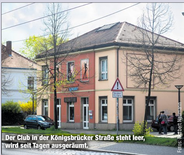
Der Club in der Königsbrücker Straße steht leer, wird seit Tagen ausgeräumt.